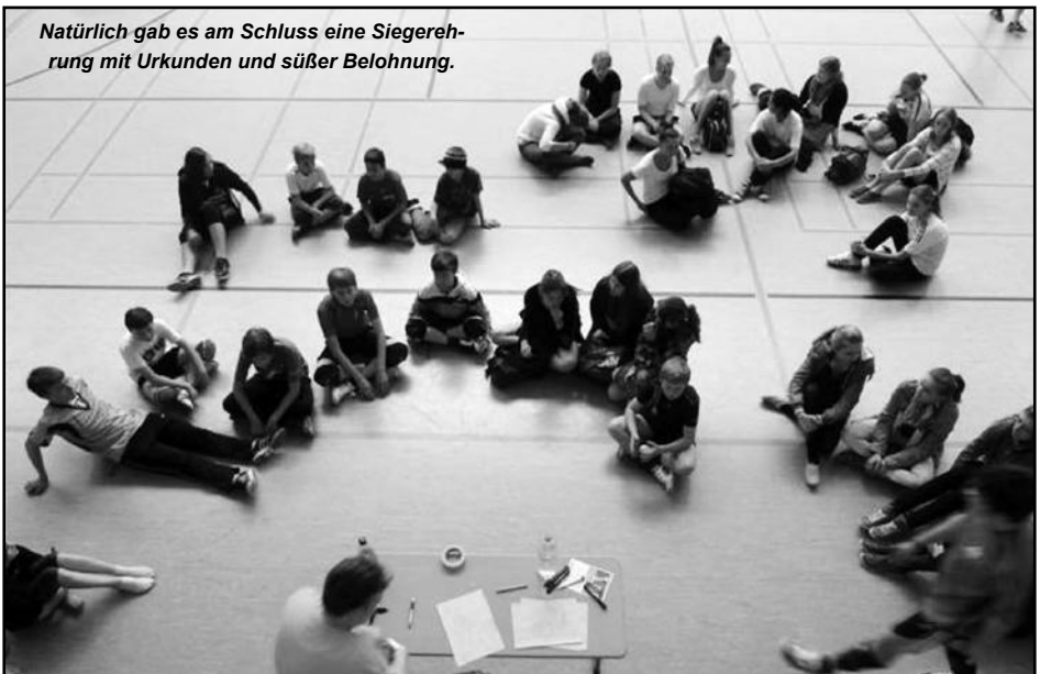
Natürlich gab es am Schluss eine Siegerehrung mit Urkunden und süßer Belohnung.